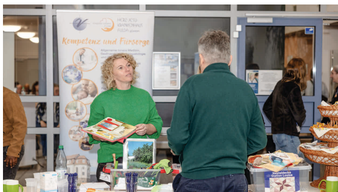
Für an Demenz erkrankte Menschen gibt es spezielle Spiele und Materialien zur Beschäftigung.

Der Pflegestützpunkt befindet sich im Behördenhaus am Schlossgarten, Heinrich-von-Bibra-Platz 5-9, 36037 Fulda. Kontakt per E-Mail: info@demenzforum-fulda.de oder Telefon 0661 6006 8782. Tipps und Hilfe auch auf www.demenzforum-fulda.de